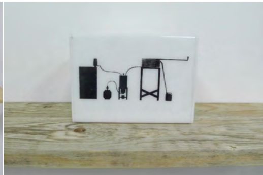
TÍTULO: «MODELO PARA UNA REFINERÍA PETROLERA DE ESCALA FAMILIAR: INVIRTIENDO EN FUTURO» MEDIDAS: 15 X 10,5 X 8 CM TÉCNICA: SERIGRAFÍA SOBRE ACRÍLICO EDICIÓN: EDICIÓN DE 3+1 P/A AÑO: 2012