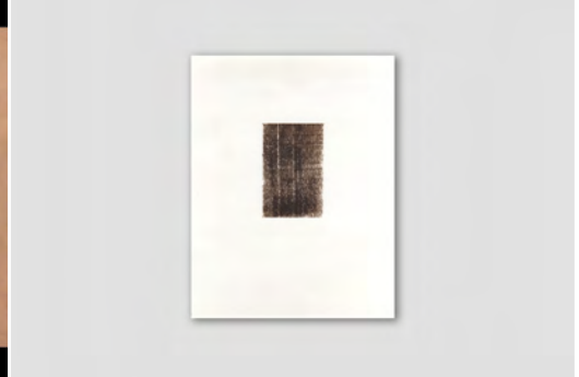
TÍTULO: «MANIFESTACIÓN DE UNA ABSTRACCIÓN SIMBÓLICA» MEDIDAS: 22,8 X 17,8 CM TÉCNICA: PETRÓLEO SERIGRAFIADO SOBRE PAPEL EDICIÓN: EDICIÓN DE 3+1 P/A AÑO: 2012