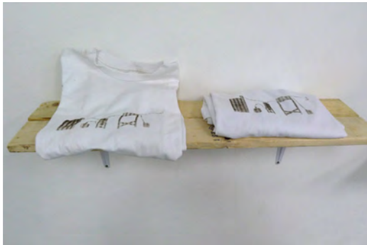
TÍTULO: «MODELO PARA UNA REFINERÍA PETROLERA DE ESCALA FAMILIAR: OIL IS EVERYWHERE» MEDIDAS: VARIABLE TÉCNICA: SERIGRAFÍA DE PETRÓLEO SOBRE FRANELA EDICIÓN: EDICIÓN DE 3+1 P/A AÑO: 2012