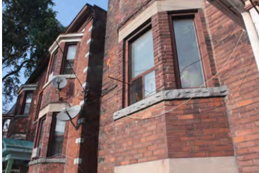
TÍTULO: «MODELO PARA UNA REFINERÍA PETROLERA DE ESCALA FAMILIAR: PRUEBA DE CONCEPTO» MEDIDAS: 56 X 76 CM TÉCNICA: FOTOGRAFÍA EDICIÓN: EDICIÓN DE 3+1 P/A AÑO: 2012