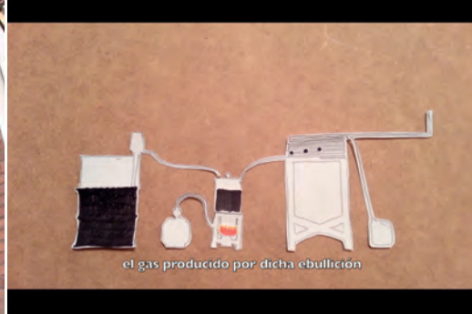
TÍTULO: «MODELO PARA UNA REFINERÍA PETROLERA DE ESCALA FAMILIAR: AUTONOMÍA PETROLERA/IDENTITARIA» MEDIDAS: N/A TÉCNICA: VIDEO EDICIÓN: EDICIÓN DE 3+1 P/A AÑO: 2012