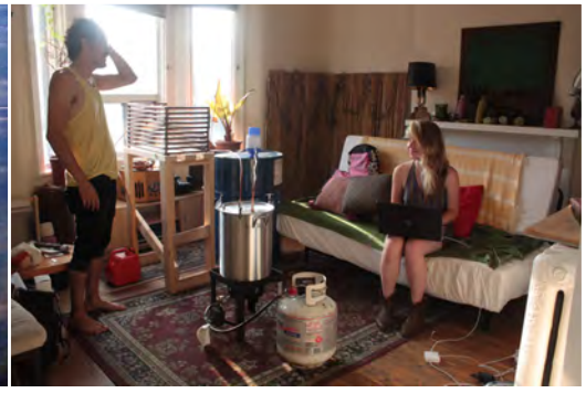
TÍTULO: «MODELO PARA UNA REFINERÍA PETROLERA DE ESCALA FAMILIAR: COTIDIANO/PETROLERO» MEDIDAS: 56 X 76 CM TÉCNICA: FOTOGRAFÍA EDICIÓN: EDICIÓN DE 3+1 P/A AÑO: 2012