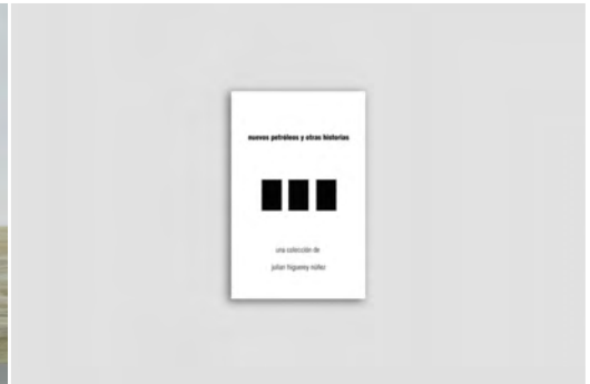
TÍTULO: «NUEVOS PETRÓLEOS Y OTRAS HISTORIAS» MEDIDAS: 56 X 76 CM TÉCNICA: IMPRESIÓN LASER EDICIÓN: EDICIÓN DE 20 AÑO: 2012