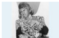
Celia Cruz y Johnny Pacheco

No todas las batallas se libran de la misma manera. Los tiempos, el entorno, las formas de la ciudadanía, sus prioridades y costumbres prefiguran esquemas de acción y reacción. En este camino incierto, las maniobras se enaltecen o se disipan, algunas llegan a término en tanto que otras se diluyen. En el contexto venezolano, un punto obviado por muchos desde un período demasiado largo demarcó una forma privativa de intercambio entre los porcentajes que integran los rangos casi equidistantes de oficialismo y