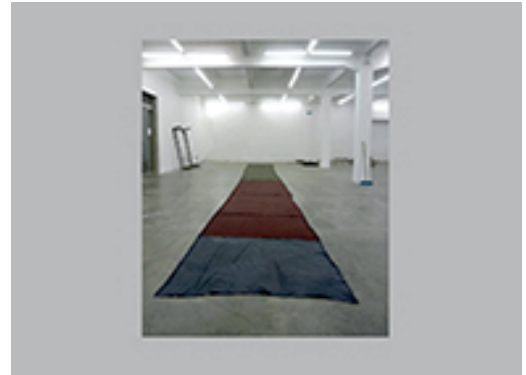
6. ALFRED WENEMOSER | PLEGADURA SENTIMENTAL 1991 | TELAS DE COLORES | DIMENSIONES VARIABLES