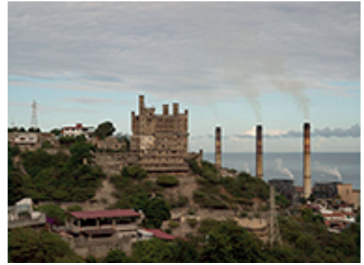
3. SUWON LEE | EL CASTILLETE | 2012 | INYECCIÓN DE TINTA SOBRE PAPEL DE ALGODÓN | 90 X 120 CM