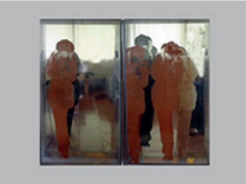
5. ANA MARÍA MAZZEI | PROGRESIÓN REAL VIRTUAL | 1972 | SERIGRAFÍA SOBRE ACRÍLICO Y ESPEJO | 2 PIEZAS | 124 X 69,5 X 12 CM C/U