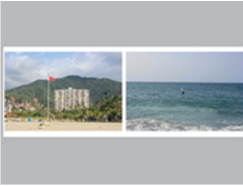
2. ANA ALENZO | LA GUAIRA | 2013 | INYECCIÓN DE TINTA SOBRE PAPEL DE ALGODÓN | 2 FOTOGRAFÍAS | 30 X 40 CM C/U