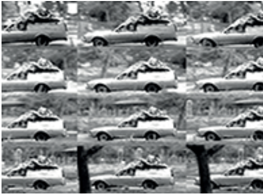
13. IVÁN CANDEO | CARROZA EN MOVIMIENTO | 2010 | 5' 10" | DVD 4:3