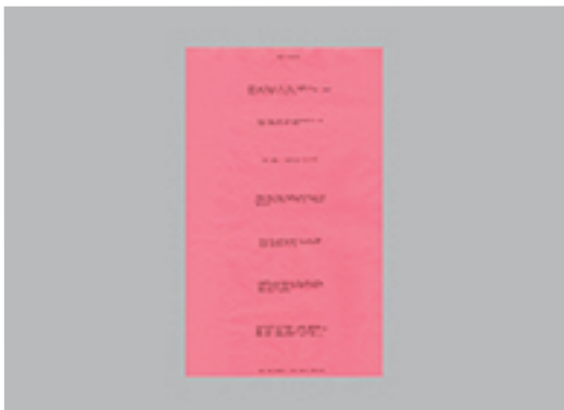
10. BRUCE NAUMAN | BODY PRESSURE | 1974 | PIEZA DE PERFORMANCE | CARTEL ORIGINALMENTE GRATUITO | 63 X 41,5 CM