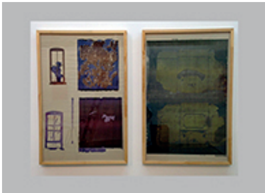
7. GORDON MATTA-CLARK | WALLS PAPER | 1972 (REIMPRESIÓN 2006) | IMPRESIONES OFFSET EN PAPEL PERIÓDICO | 2 PIEZAS. 90 X 59 CM C/U