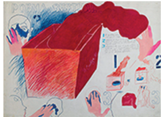
9. DIEGO BARBOZA | POEMA GESTUAL | 1981 | CAJA ROJA (70 X 70 X 70 CM) | INDICACIONES PARA REALIZAR LA ACCIÓN (70 X 100 CM)