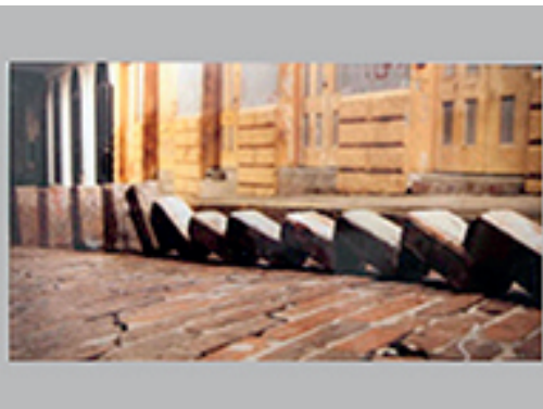
11. DONNA CONLON / JONATHAN HARKER / | EFECTO DOMINÓ | 2013 | 5'15" | HD 16:9