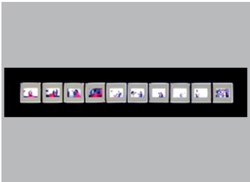
16. DIEGO BARBOZA | REGISTRO ACCIÓN POEMA GESTUAL | SALA MENDOZA, 1981 | 10 DIAPOSITIVAS (5 X 5 CM C/U)