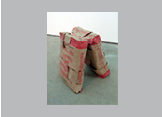
4. ERNESTO MONTIEL | BRUTAL REFLEXIÓN BRUTALISTA 2013 | SACOS DE CEMENTO | 50 X 62 X 43 CM