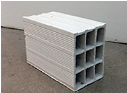
19. OSCAR ABRAHAM PABÓN | ORNATO Y PUREZA | 2011 | LADRILLO ESMALTEADO | 20 X 30 X 15 CM

ESCALA. Exposición Colectiva. Desde el 23/3/2014 hasta el 27/4/2014 Exposición #67. Texto: Félix Suazo