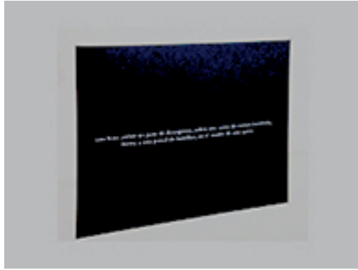
14. JULIÁN HIGUERAY | UN ASIÁTICO CON UN YESO... | 2010 | FOTOGRAFÍA | 8 X 10"