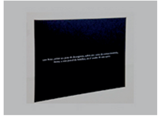
15. JULIÁN HIGUERAY | UNA BOTA, SOBRE UN POTE DE DETERGENTE... | 2010 | FOTOGRAFÍA | 8 X 10"