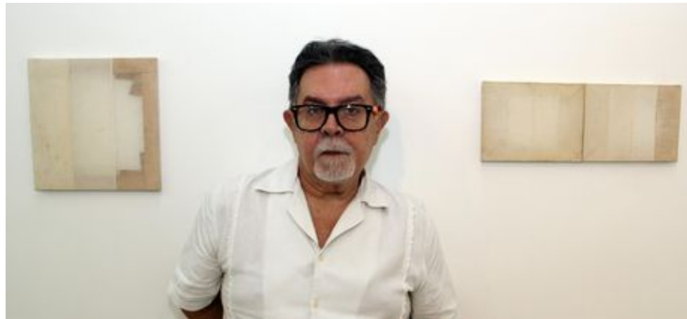
En octubre Tagliafico llevará una selección de la muestra a la galería Henrique Faria Fine Art de Nueva York

--- Picapedra regresan al cine con cinta