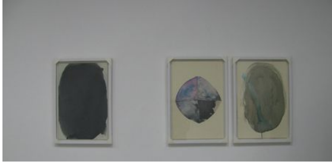
Revisiones domésticas